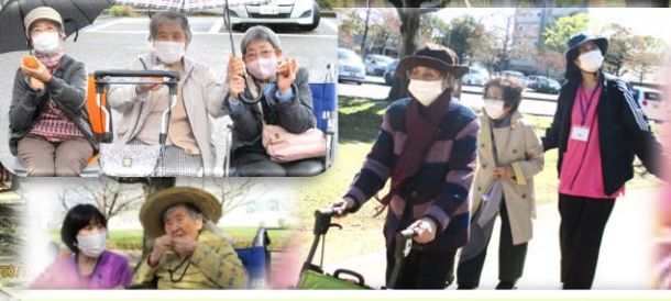
宮崎県総合文化公園へ行きました